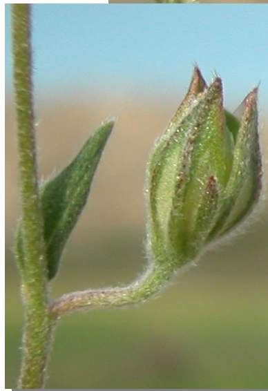
H. salicifolium . Detalle de la flor y la cápsula.