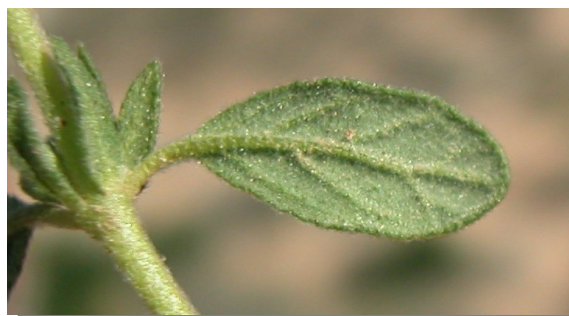
H. salicifolium . Detalle de la hoja: envés