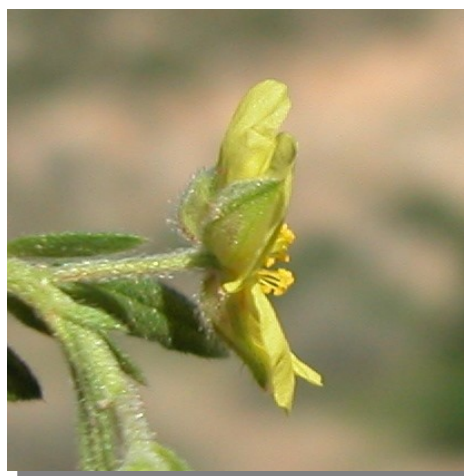
H. salicifolium . Detalle de la flor