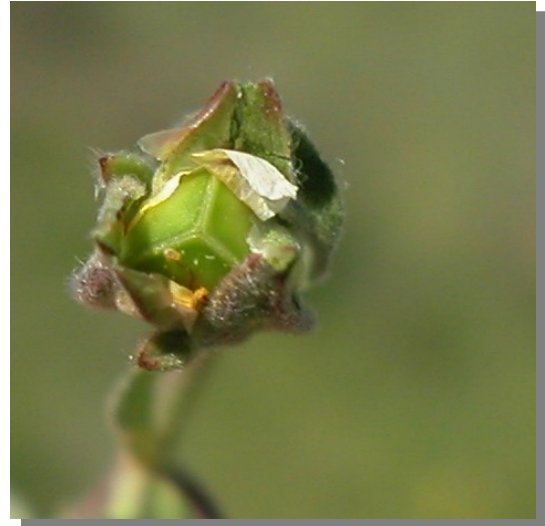
H. salicifolium . Detalle de cápsula inmadura