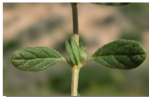
H. salicifolium . Detalle de las hojas