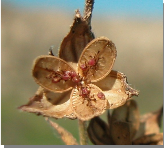
H. salicifolium . Detalle de la cápsula abierta