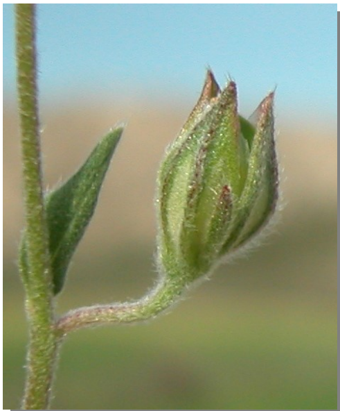
H. salicifolium . Detalle de cápsula inmadura