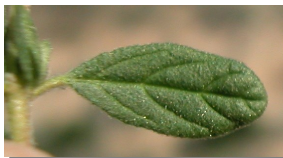
H. salicifolium . Detalle de la hoja: haz