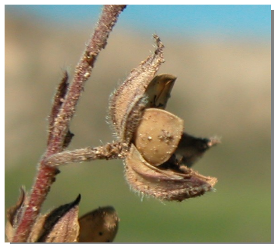
H. salicifolium . Detalle de la cápsula abierta