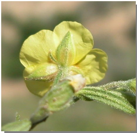
H. salicifolium . Detalle del cáliz