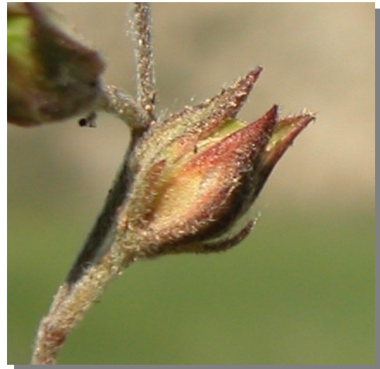
H. salicifolium . Detalle de la cápsula