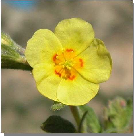
H. salicifolium . Detalle de la corola