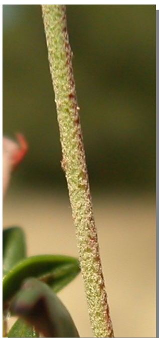
H. marifolium . Detalle del tallo