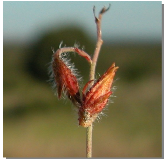
H. marifolium . Detalle de la cápsula