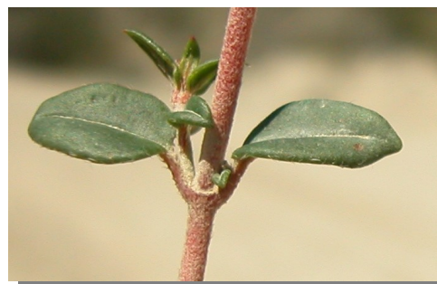
H. marifolium . Detalle de las hojas