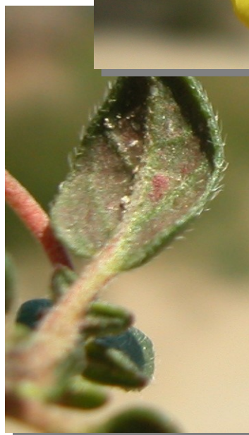
H. marifolium . Detalle de la flor y las hojas.