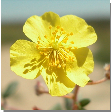
H. marifolium . Detalle de la corola