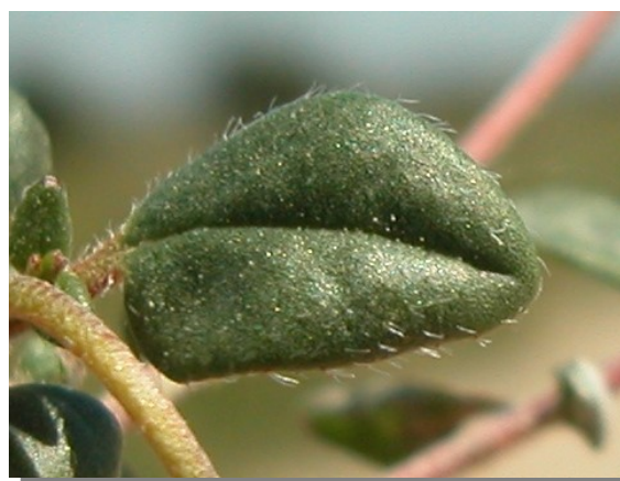
H. marifolium . Detalle de la hoja: haz