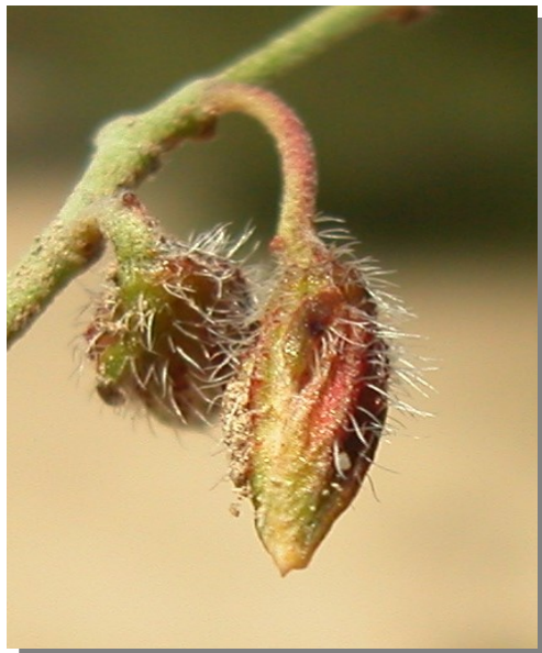
H. marifolium . Detalle de cápsula inmadura