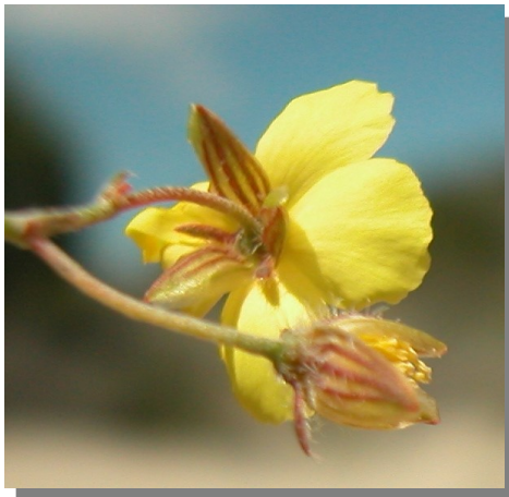
H. marifolium . Detalle del cáliz