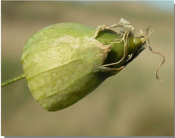
S. vulgaris . Detalle del fruto