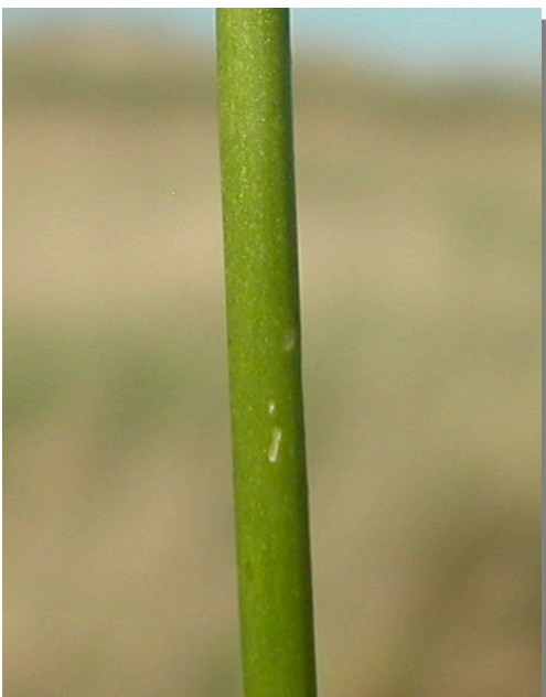
S. vulgaris . Detalle del tallo