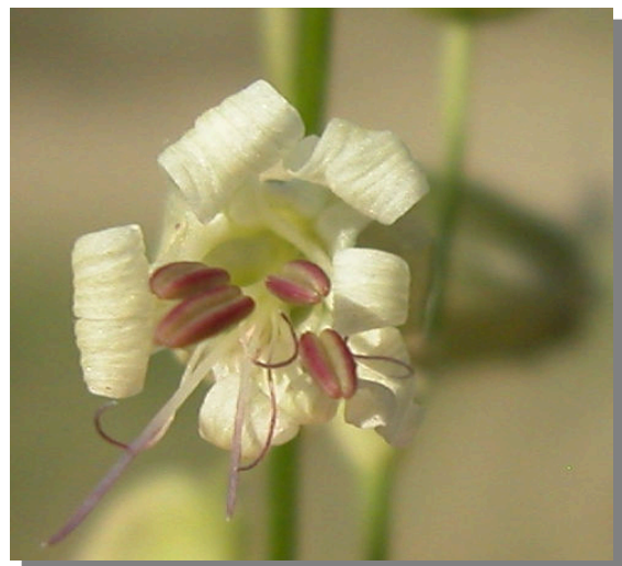
S. vulgaris . Detalle de la corola