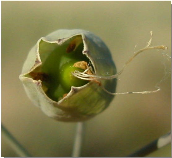
S. vulgaris . Detalle del fruto