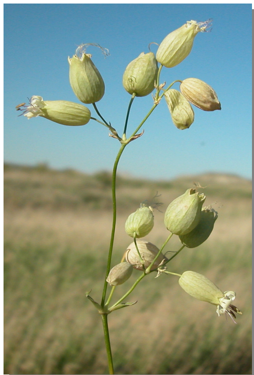
S. vulgaris . Detalle de la inflorescencia