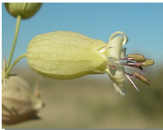
S. vulgaris . Detalle de la flor