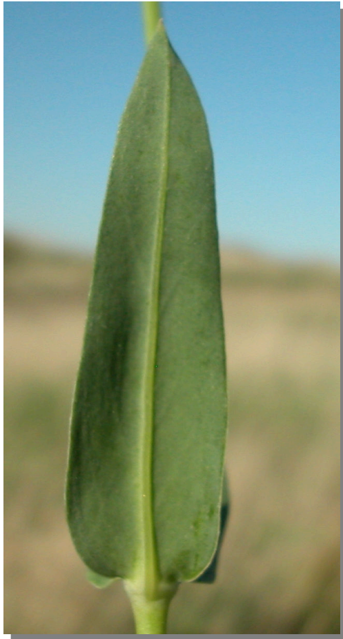
S. vulgaris . Detalle de la hoja: envés