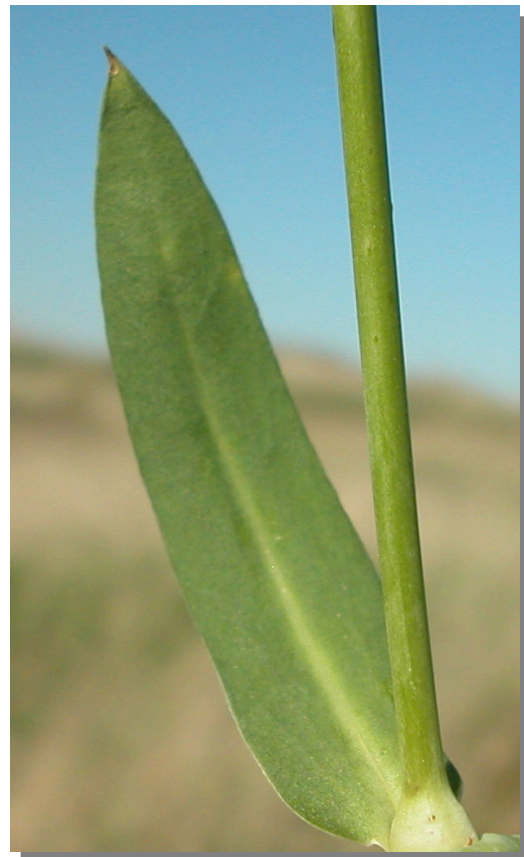
S. vulgaris . Detalle de la hoja: haz