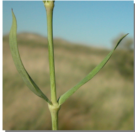
S. vulgaris . Detalle de las hojas