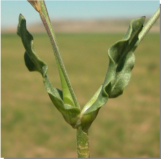
S. rubella . Detalle de hojas superiores