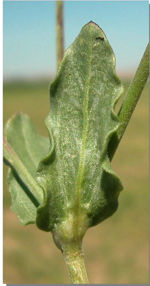
S. rubella . Detalle de hoja superior: envés