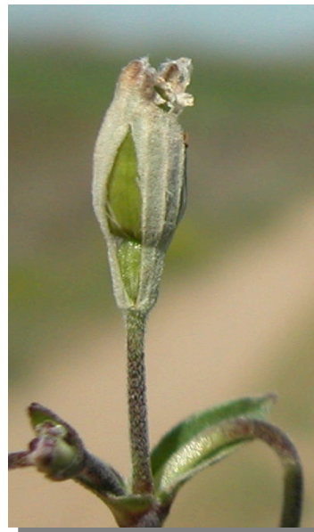
S. rubella . Detalle del fruto