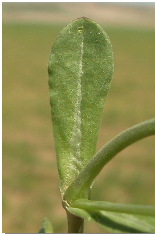
S. rubella . Detalle de hoja inferior: haz