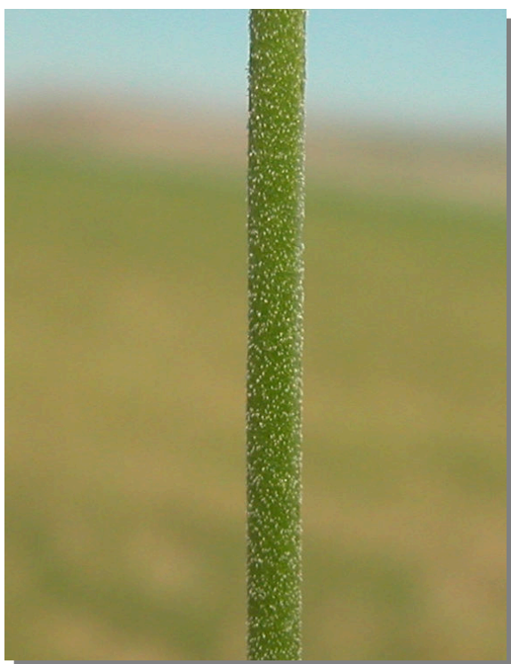
S. rubella . Detalle del tallo