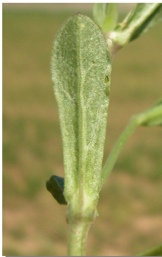
S. rubella . Detalle de hoja inferior: envés