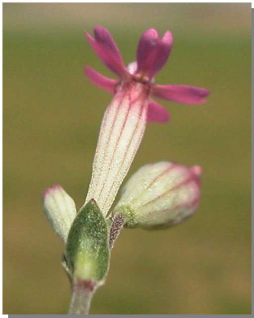
S. rubella . Detalle del cáliz