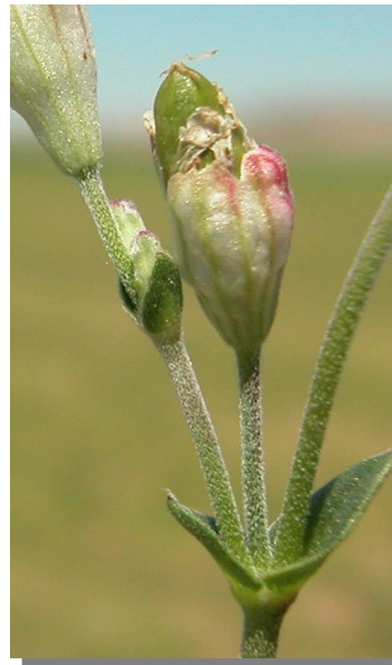
S. rubella . Detalle del fruto