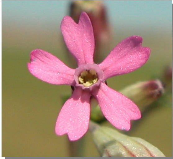
S. rubella . Detalle de la corola