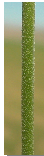
S. rubella . Detalle de la flor y tallo