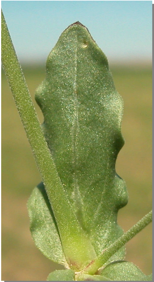
S. rubella . Detalle de hoja superior: haz