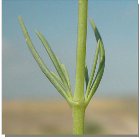
G. struthium . Detalle de las hojas