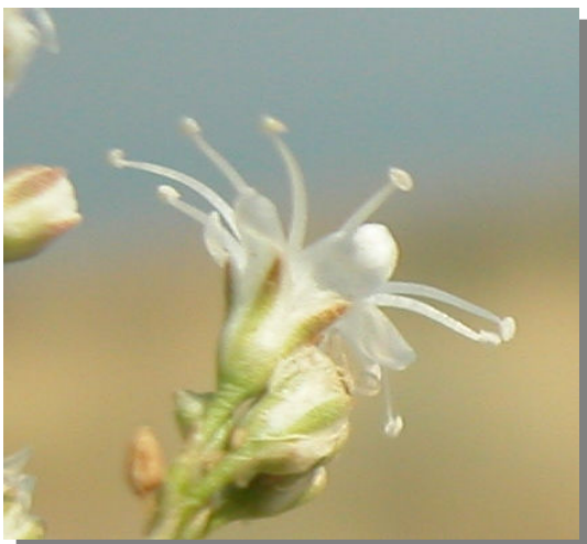
G. struthium . Detalle del cáliz