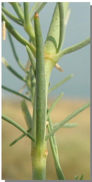
G. struthium . Detalle de la hoja: envés