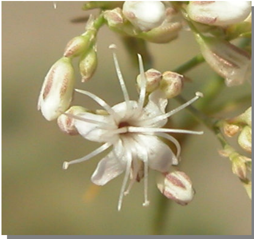
G. struthium . Detalle de la corola