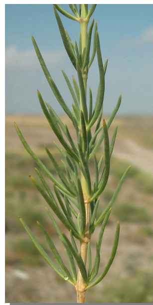
G. struthium . Detalle de una rama