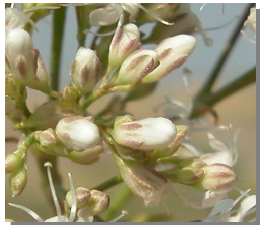
G. struthium . Detalle de botones florales