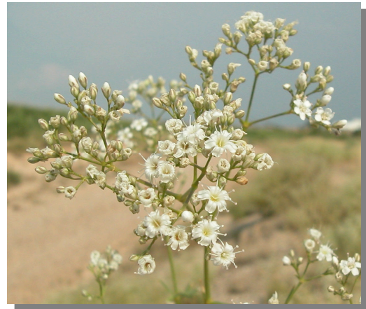
G. struthium . Detalle de la inflorescencia