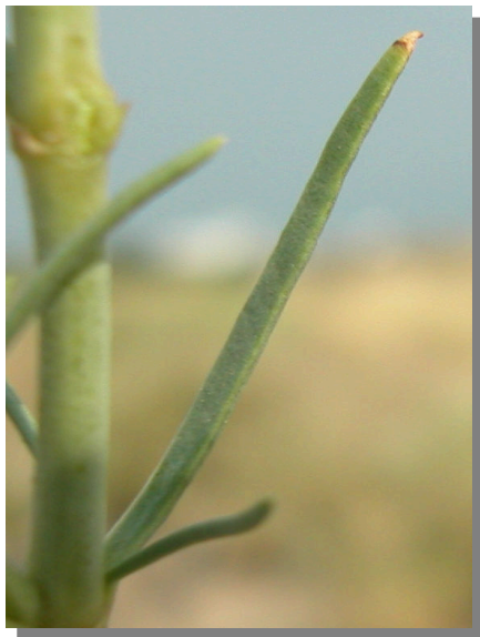
G. struthium . Detalle de la hoja: haz