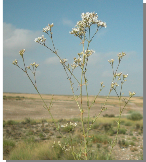
G. struthium . Detalle de la inflorescencia