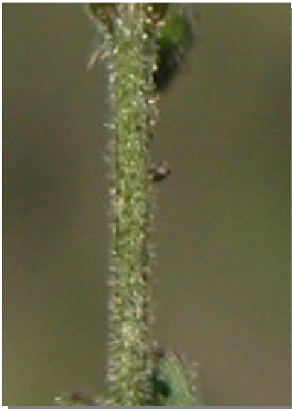
C. gracile . Detalle del tallo