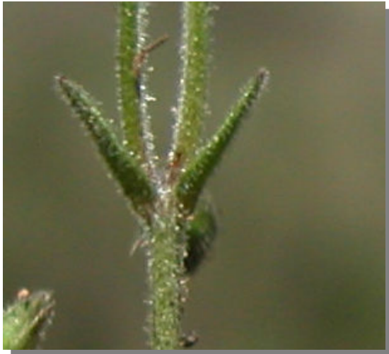
C. gracile . Detalle hojas superiores