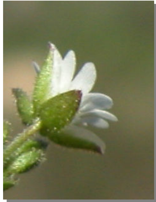
C. gracile . Detalle del cáliz