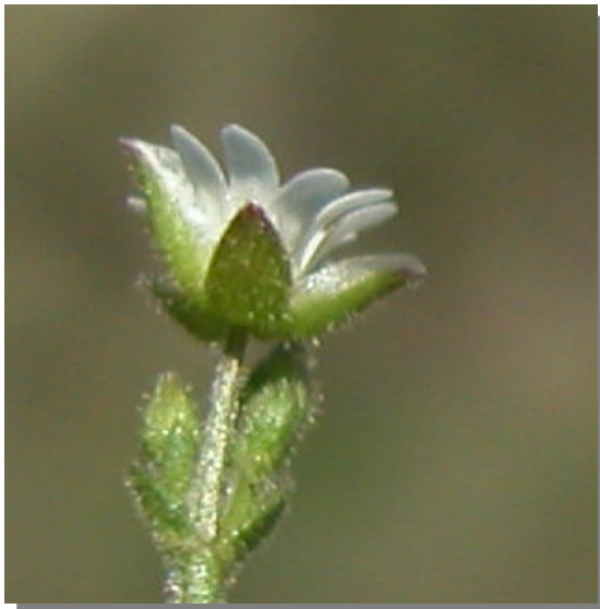
C. gracile . Detalle de la flor