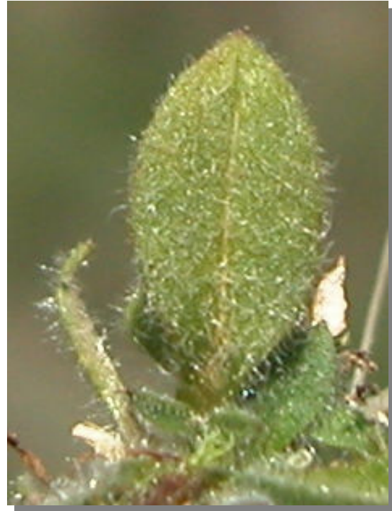
C. gracile . Detalle de hoja inferior: haz