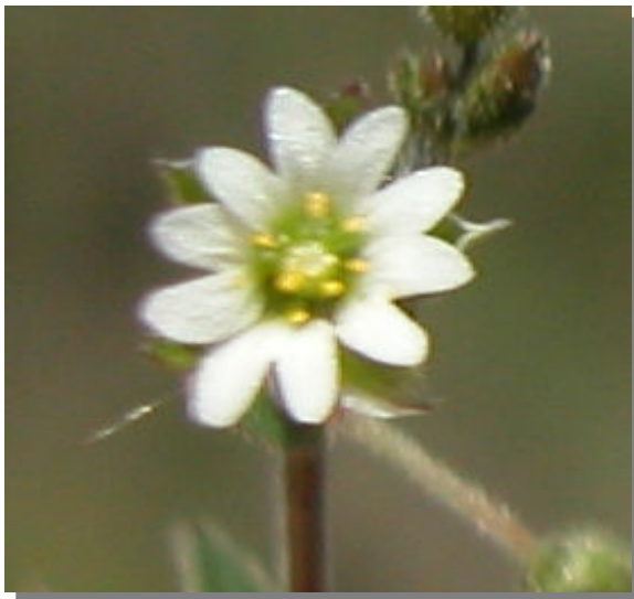
C. gracile . Detalle de la corola