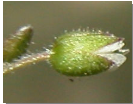
C. gracile . Detalle del fruto