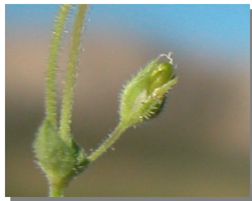
C. gracile . Detalle del fruto