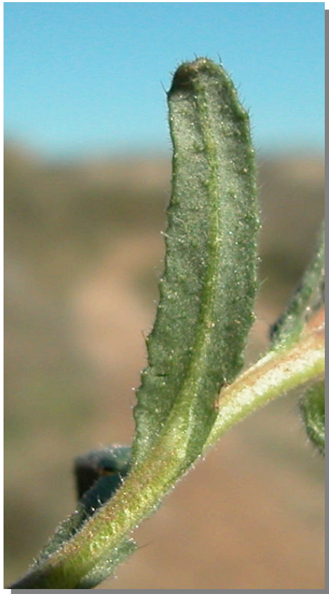
N. micrantha . Detalle de la hoja: envés