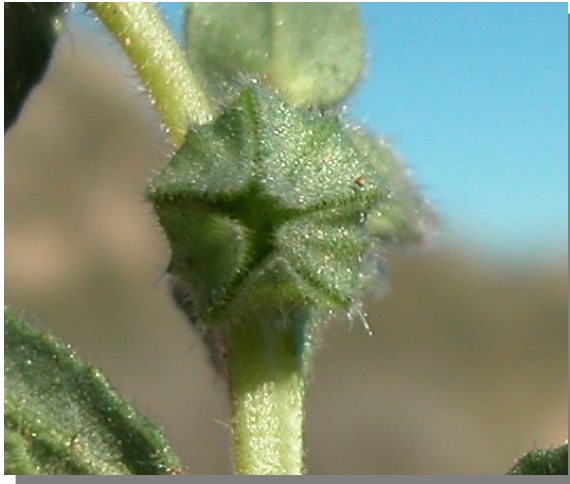
N. micrantha . Detalle del cáliz en fruto