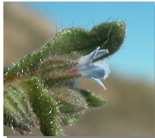
N. micrantha . Flores azuladas