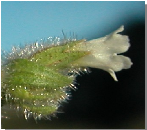
N. echoides . Flores blancas