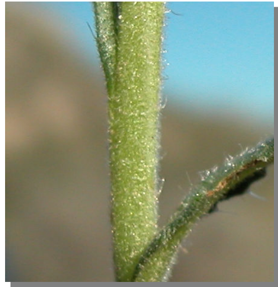
N. micrantha . Detalle del tallo