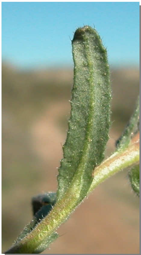
N. micrantha . Detalle de la hoja: envés