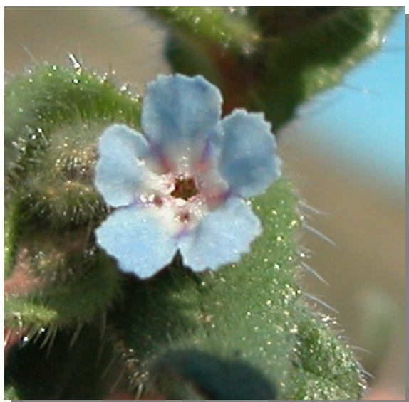
N. micrantha . Detalle de la corola