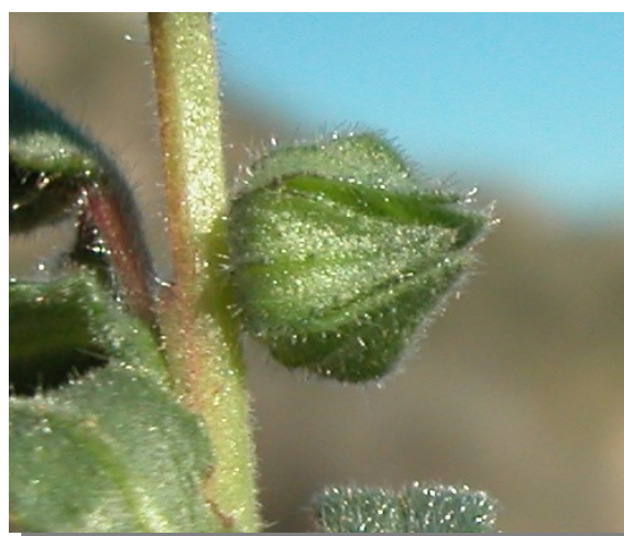
N. micrantha . Detalle del cáliz en fruto