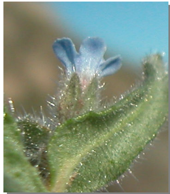
N. micrantha . Detalle del cáliz