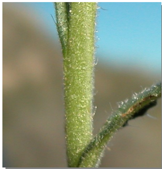
N. micrantha . Detalle del tallo