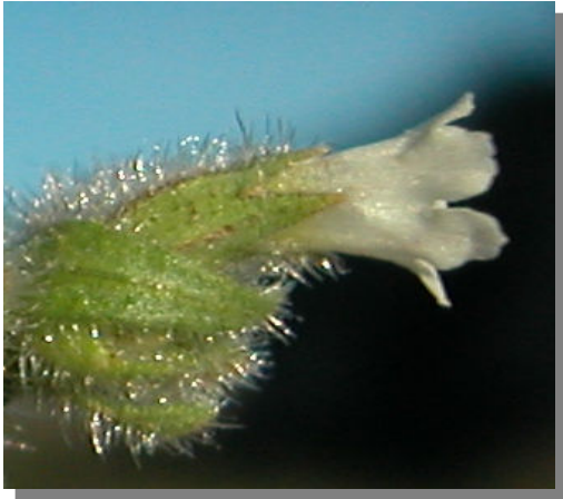
N. echoides . Flores blancas