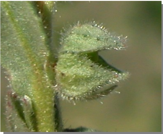
N. micrantha . Detalle del cáliz en fruto