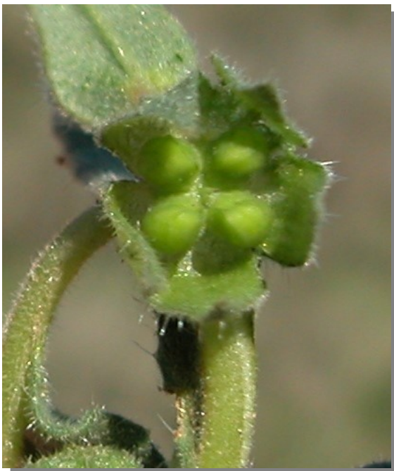
N. micrantha . Detalle de las núculas