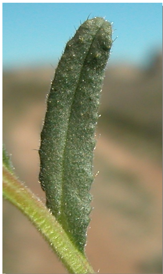
N. micrantha . Detalle de la hoja: haz