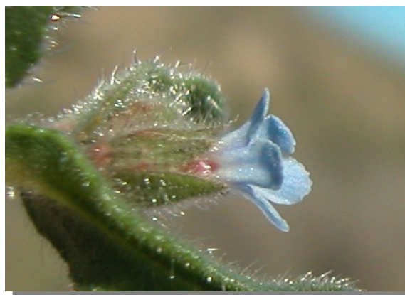
N. micrantha . Detalle de la flor y bráctea floral