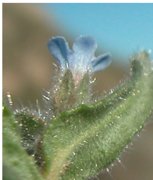
N. micrantha . Detalle del cáliz