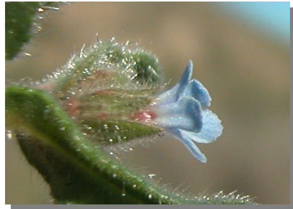
N. micrantha . Detalle de la flor y bráctea floral