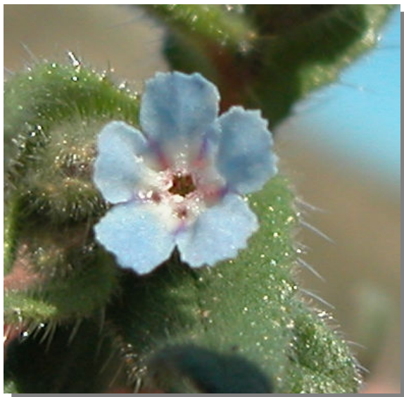
N. micrantha . Detalle de la corola