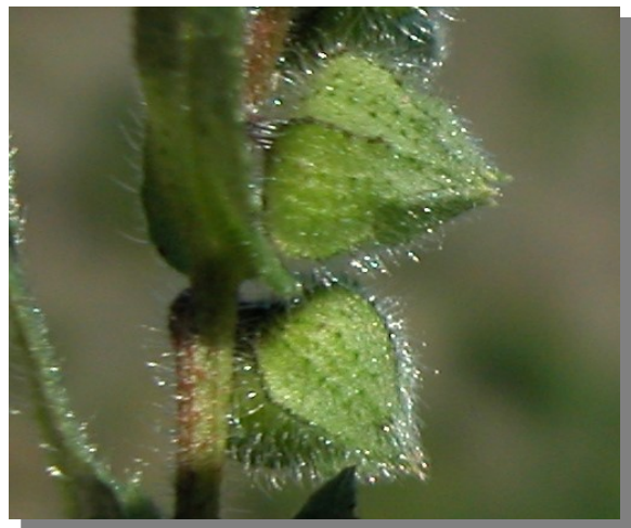
N. echioides . Detalle del cáliz en fruto