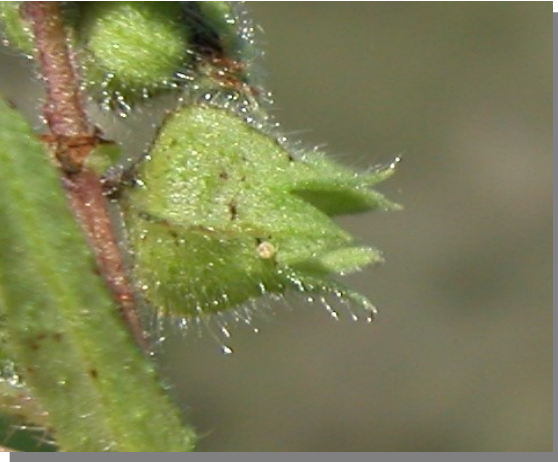
N. echioides . Detalle del cáliz en fruto