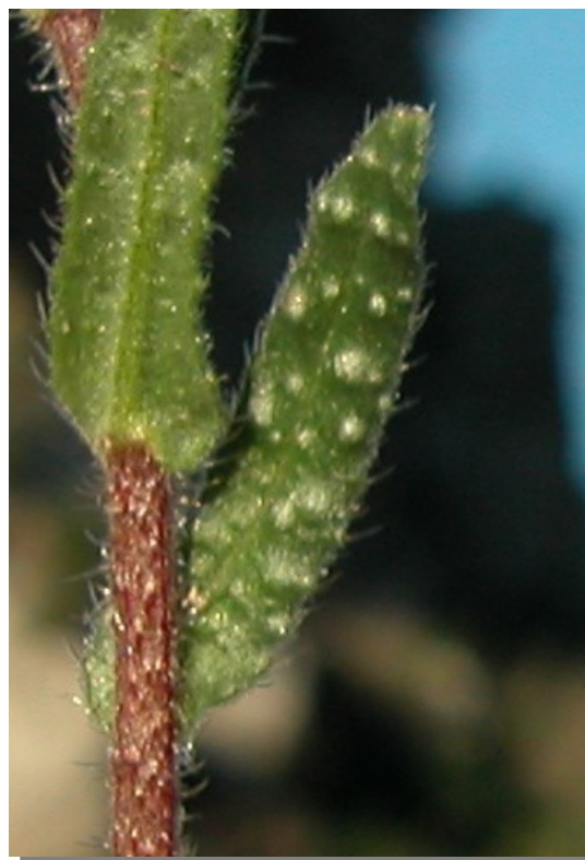
N. echioides . Detalle de la hoja: haz