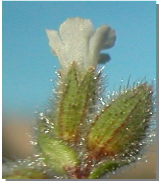
N. echioides . Detalle del cáliz