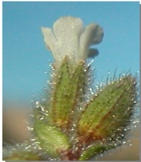
N. echioides . Detalle del cáliz