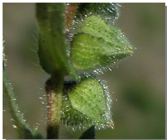
N. echioides . Detalle del cáliz en fruto