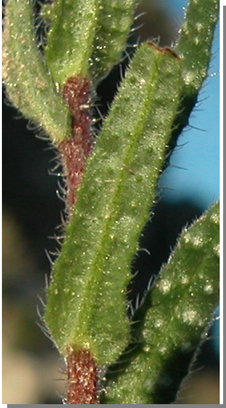
N. echioides . Detalle de la hoja: envés