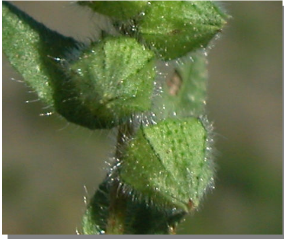
N. echioides . Detalle del cáliz en fruto