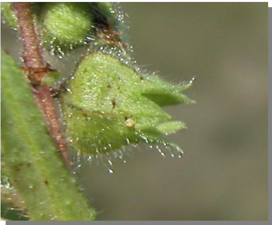
N. echioides . Detalle del cáliz en fruto