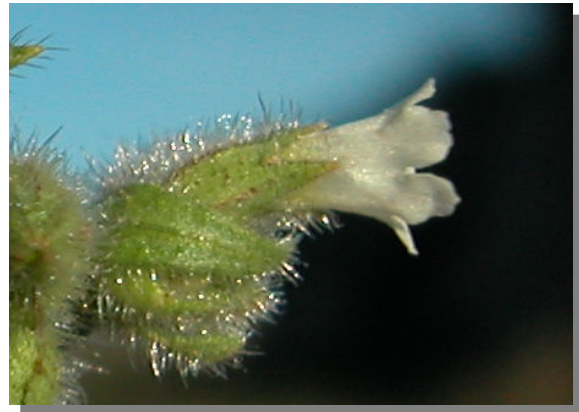
N. echioides . Detalle de la flor y bráctea floral