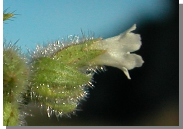
N. echioides . Detalle de la flor y bráctea floral