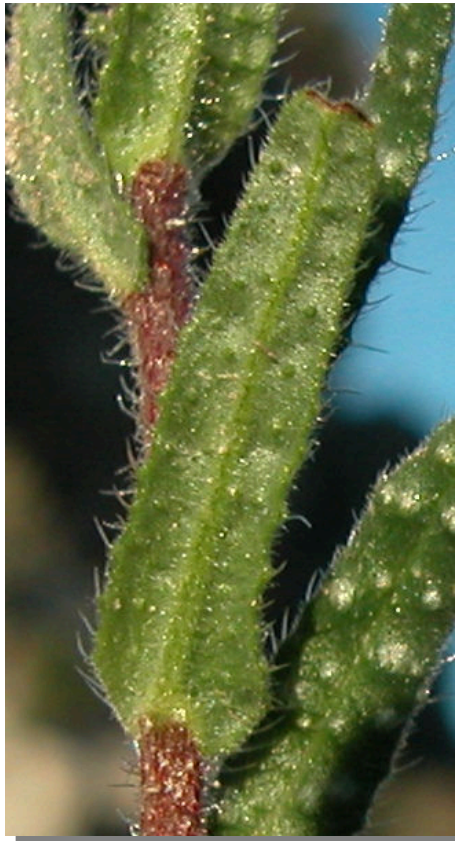
N. echioides . Detalle de la hoja: envés