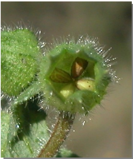
N. echioides . Detalle de las núculas