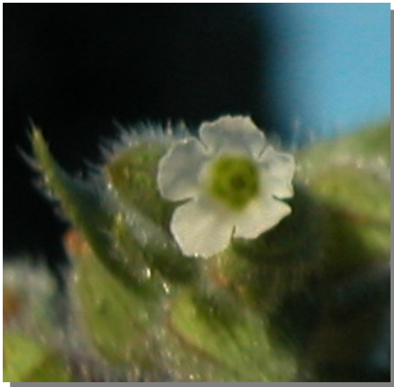
N. echioides . Detalle de la corola