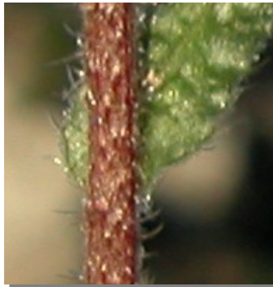
N. echioides . Detalle del tallo