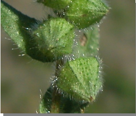
N. echioides . Detalle del cáliz en fruto