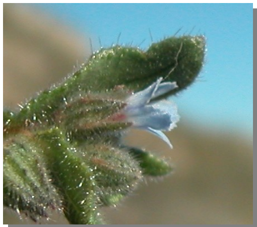
N. micrantha . Flores azuladas