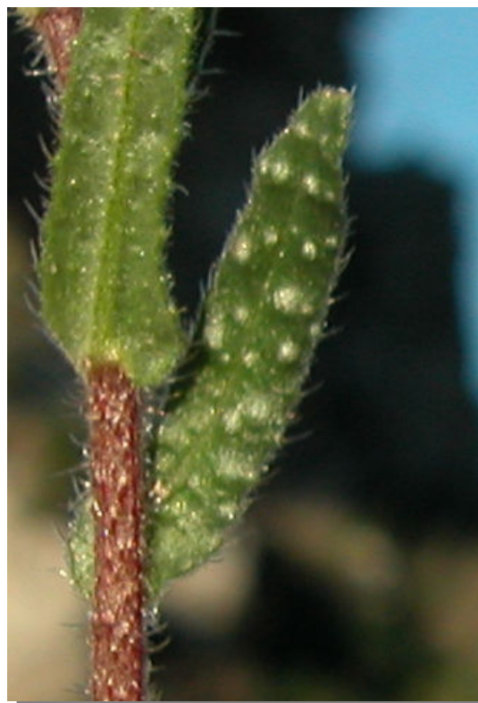
N. echioides . Detalle de la hoja: haz