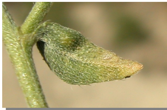
L. squarrosa . Detalle de hoja superior: envés.