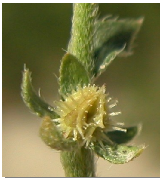
L. squarrosa . Detalle del fruto.