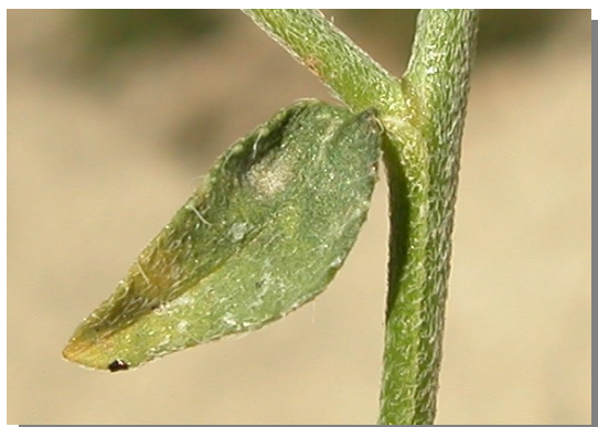
L. squarrosa . Detalle de hoja superior: haz.