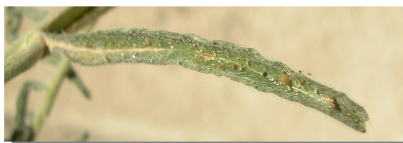
L. squarrosa . Detalle de hoja basal: haz.