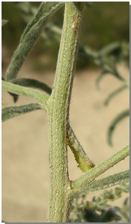
L. squarrosa . Detalle del tallo.