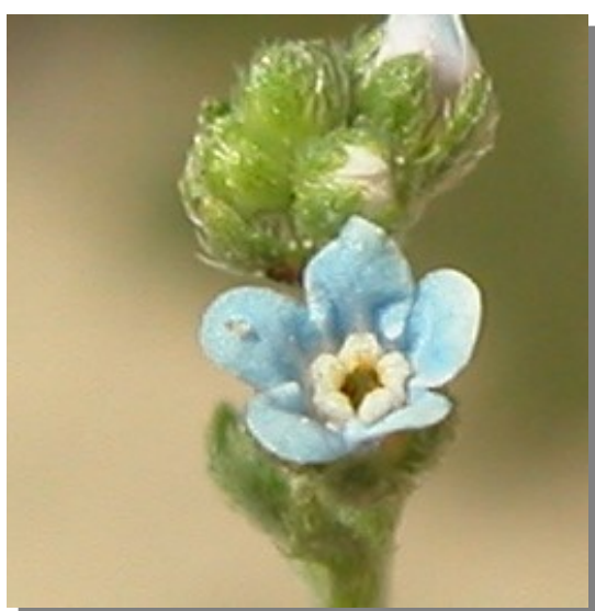
L. squarrosa . Detalle de la corola