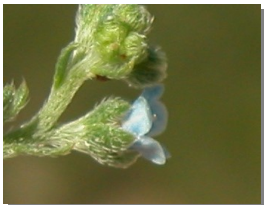
L. squarrosa . Detalle de la flor.