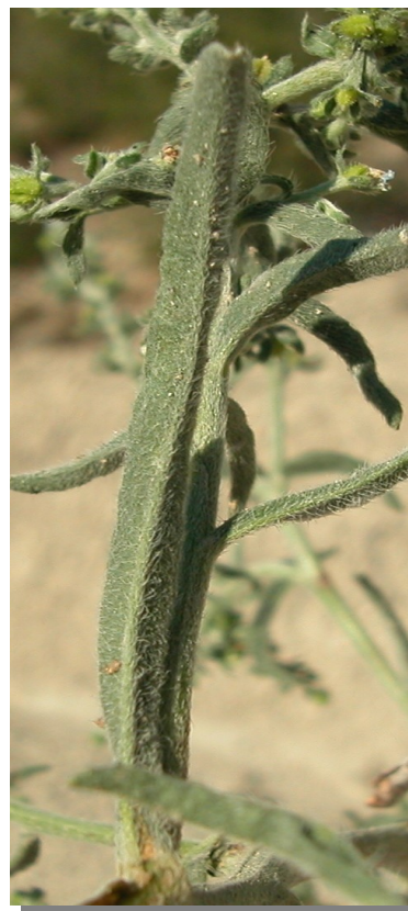
L. squarrosa . Detalle de hoja basal: envés.