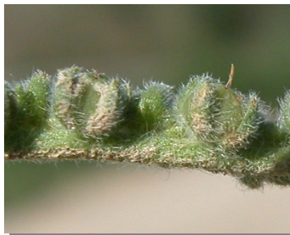
H. europaeum . Detalle de los frutos.