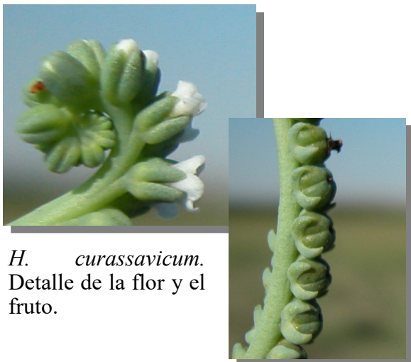
H. curassavicum . Detalle de la flor y el fruto.

La forma de la espiga, enrollada en la punta y con las flores en un lateral, diferencian a esta especie de las demás Boraginaceae excepto de H. curassavicum , que carece de vellosidad, tiene un color azulado y fruto con cuatro lóbulos.