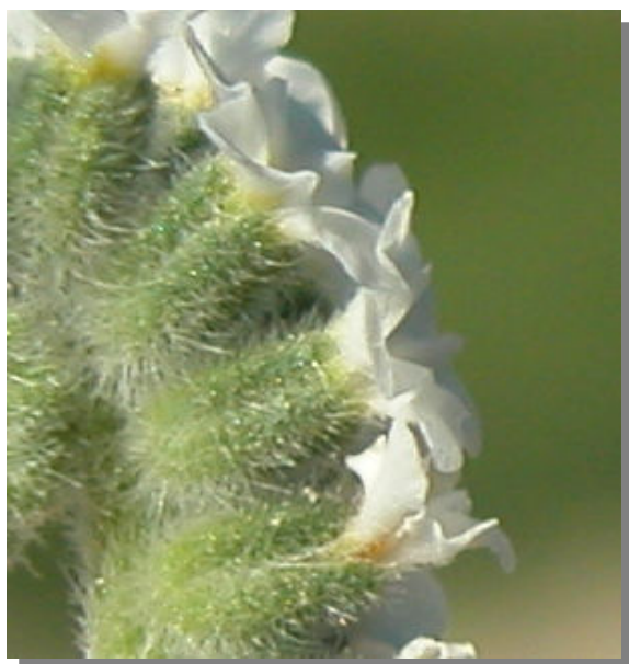
H. europaeum . Detalle de las flores