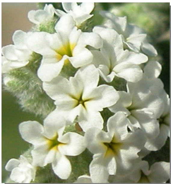
H. europaeum . Detalle de la corola.