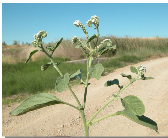
H. europaeum . Detalle de las espigas florales