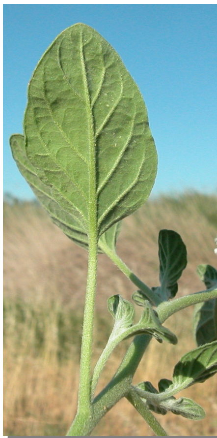
H. europaeum . Detalle de la hoja: envés