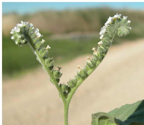
H. europaeum . Detalle de las inflorescencias.