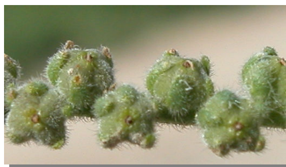
H. europaeum . Detalle de los frutos.