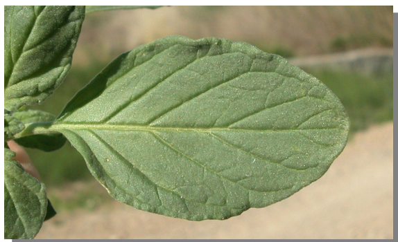
H. europaeum . Detalle de la hoja: haz.