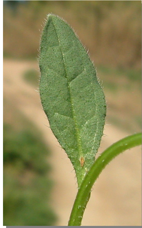
A. procumbens . Detalle de hojas superiores: haz