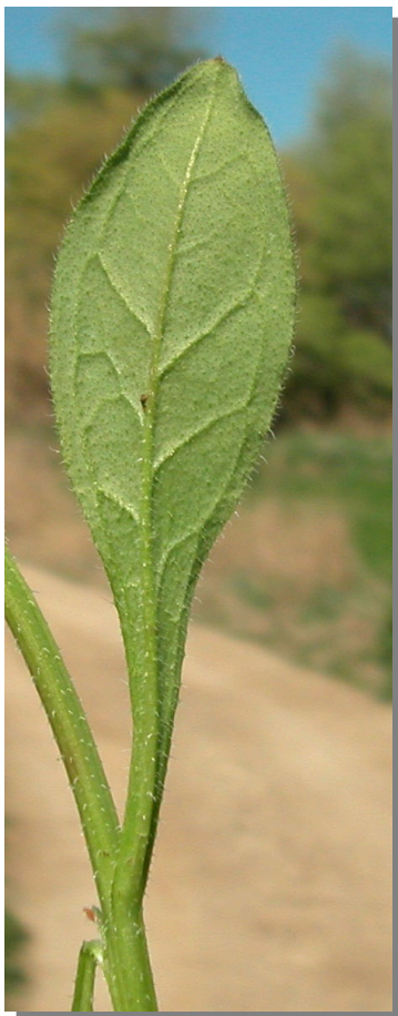
A. procumbens . Detalle de hojas inferiores: envés