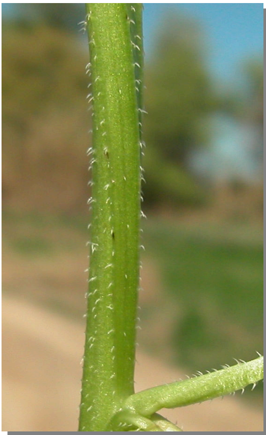
A. procumbens . Detalle del tallo