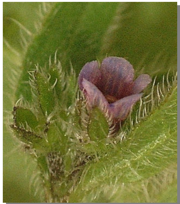
A. procumbens . Detalle de la flor