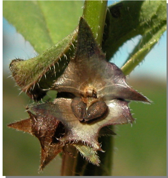
A. procumbens . Detalle de las núculas