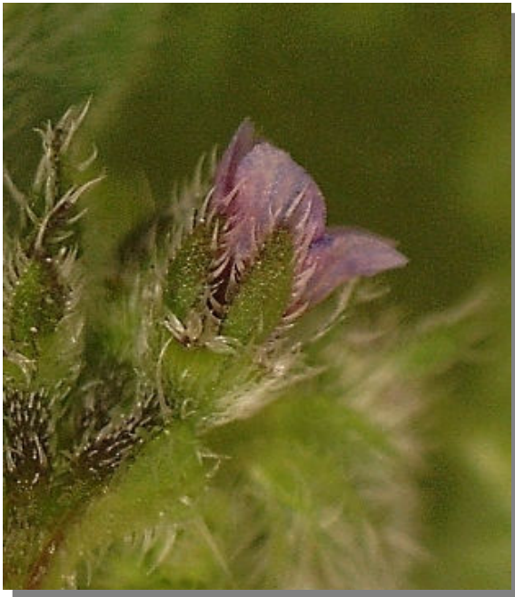
A. procumbens . Detalle del cáliz en floración