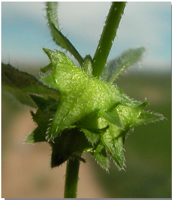
A. procumbens . Detalle del cáliz en fructificación