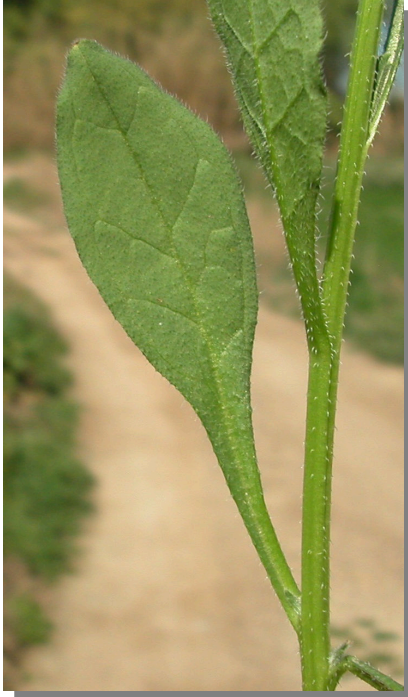
A. procumbens . Detalle de hojas inferiores: haz