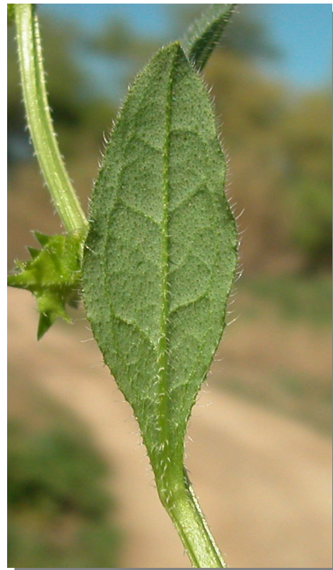
A. procumbens . Detalle de hojas superiores: envés