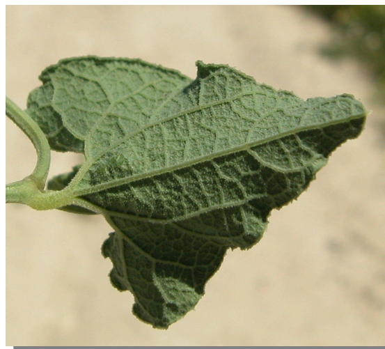
A. pistolochia . Detalle de la hoja: envés