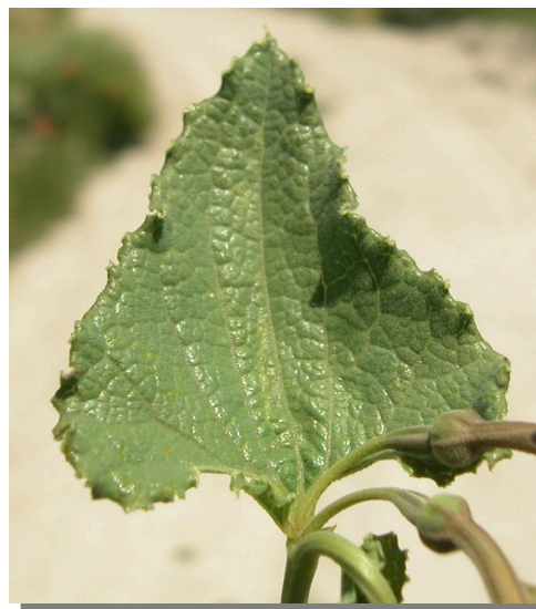
A. pistolochia . Detalle de la hoja: haz