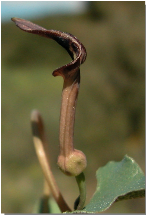
A. pistolochia . Detalle de la flor