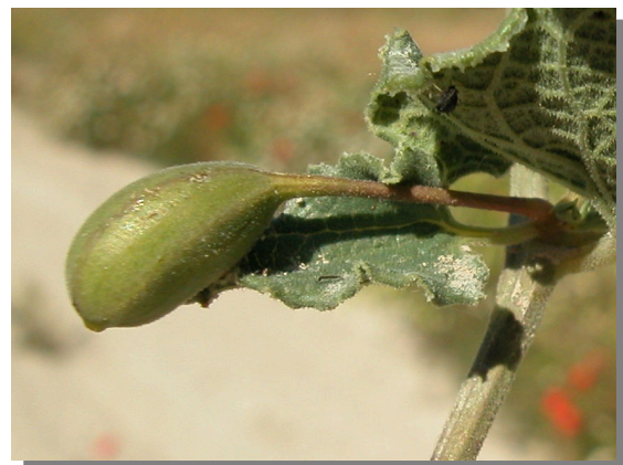
A. pistolochia . Detalle del fruto