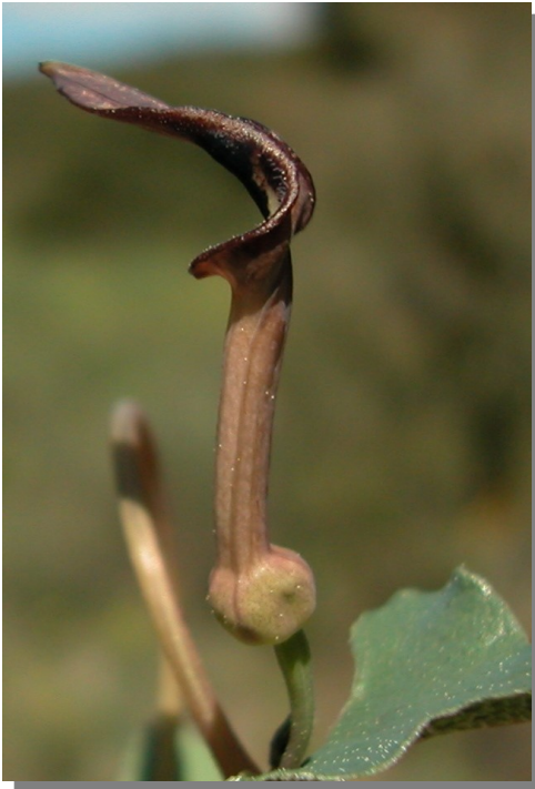
A. pistolochia . Detalle de la flor