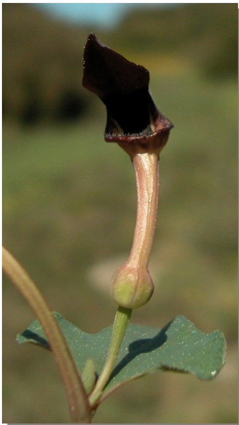
A. pistolochia . Detalle de la flor