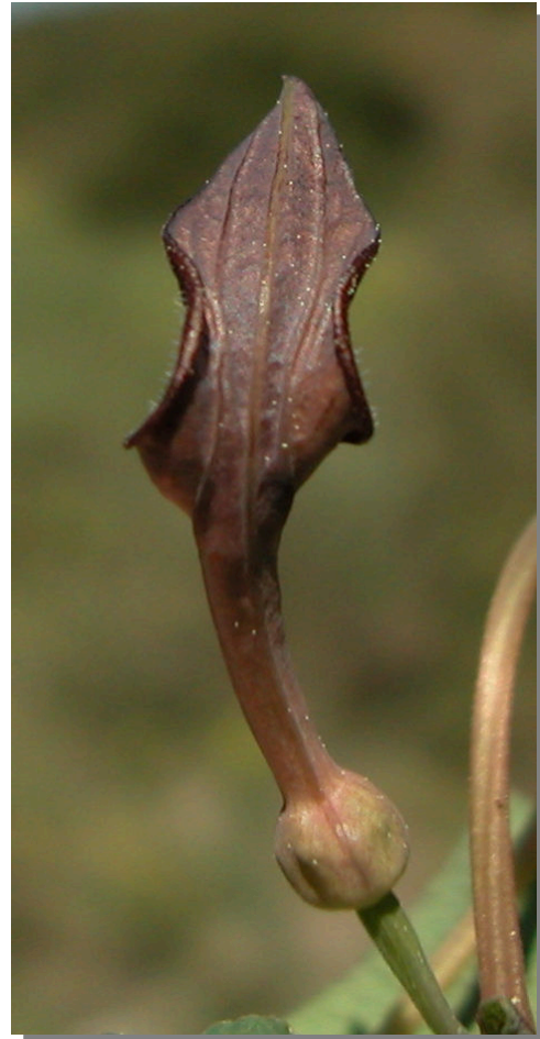
A. pistolochia . Detalle de la flor