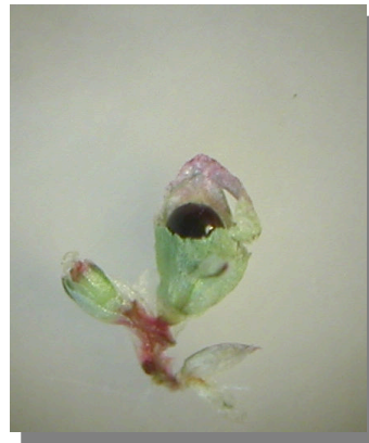
A. deflexus . Detalle del tamaño de la semilla respecto al fruto

Semilla de tamaño menor que la cavidad del fruto.