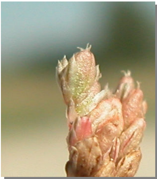
A. deflexus . Detalle del fruto