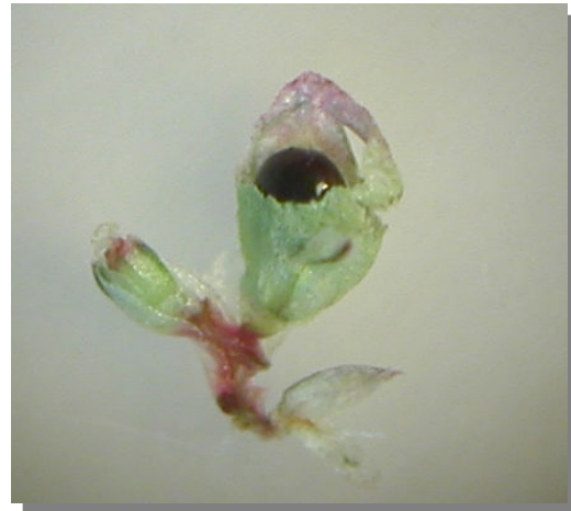
A. deflexus . Detalle de la semilla