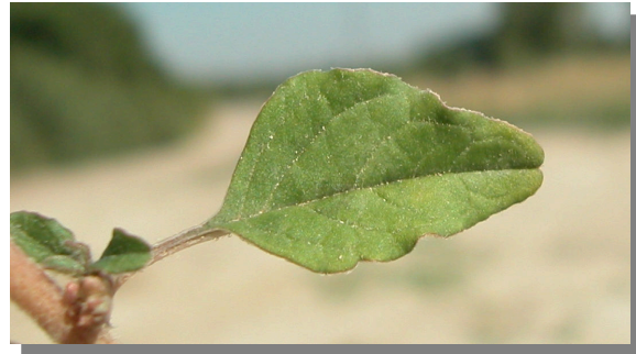
A. deflexus . Detalle de una hoja: haz