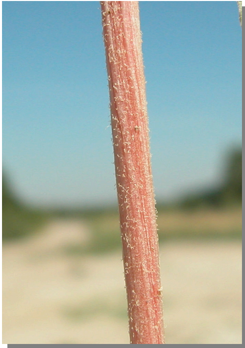
A. deflexus . Detalle del tallo