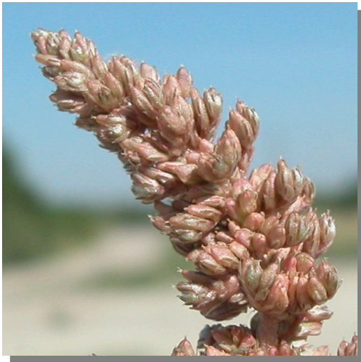
A. deflexus . Detalle de espiga con frutos