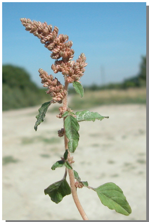
A. deflexus . Detalle de una rama