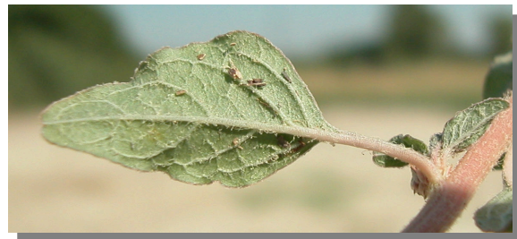
A. deflexus . Detalle de una hoja: envés