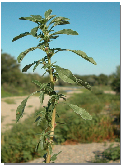
A. blitoides . Detalle de una rama