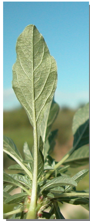
A. blitoides . Detalle de una hoja: envés