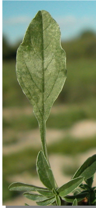
A. blitoides . Detalle de una hoja: haz