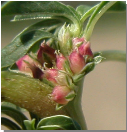
A. blitoides . Detalle del fruto