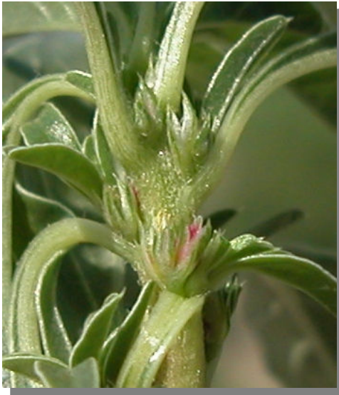
A. blitoides . Detalle de la inflorescencia