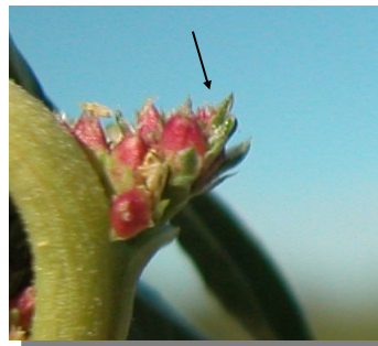
A. blitoides . Detalle de tépalos y fruto.

Flores con 4-5 tépalos desiguales, el mayor de longitud igual o mayor que el fruto.