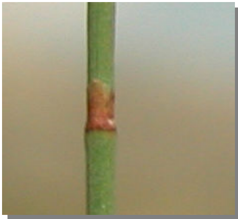
E. nebrodensis . Detalle de hoja adulta