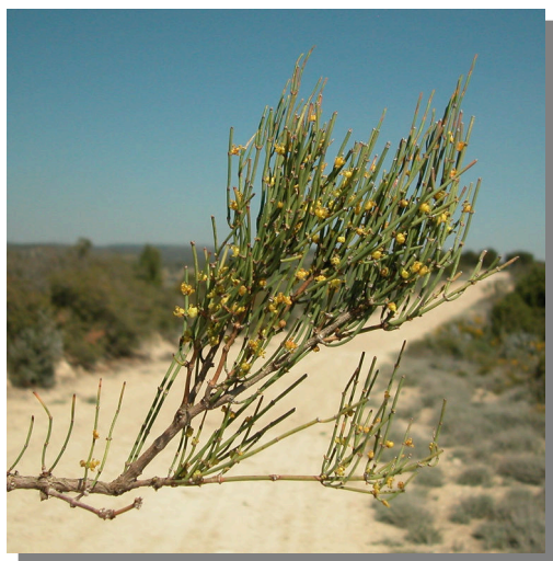
E. nebrodensis . Detalle de rama con conos masculinos