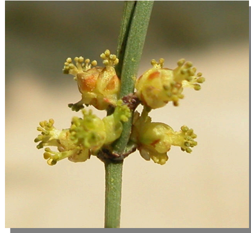
E. nebrodensis . Detalle de conos masculinos