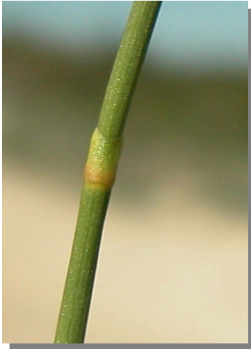
E. nebrodensis . Detalle de hoja juvenil