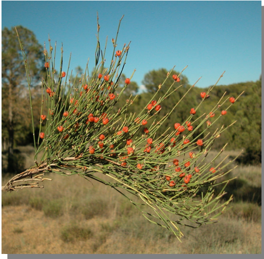
E. nebrodensis . Detalle de rama con estróbilos