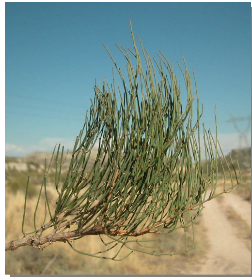
E. nebrodensis . Detalle de rama