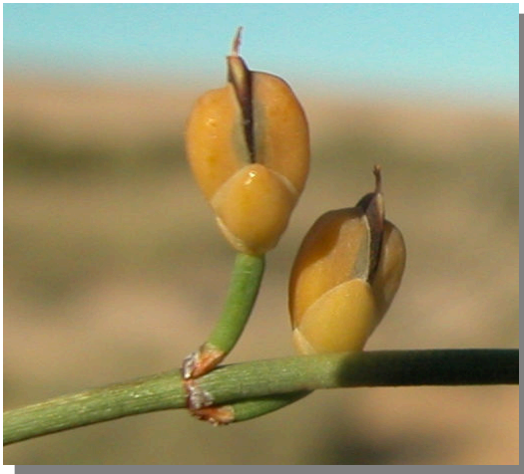
E. nebrodensis . Detalle de estróbilos con brácteas amarillas