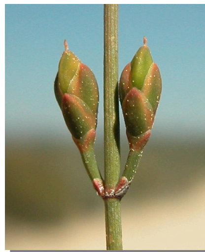
E. nebrodensis . Detalle de conos femeninos