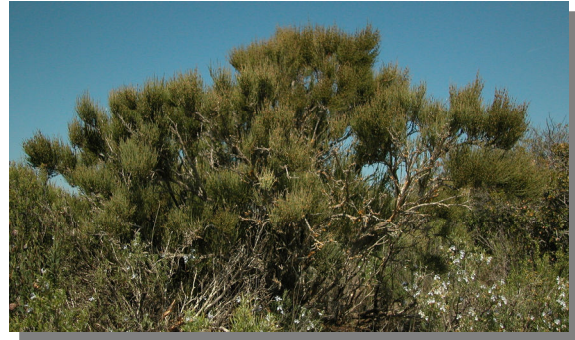
E. nebrodensis . Pie femenino. Vireta; Pina de Ebro (16/04/2014)