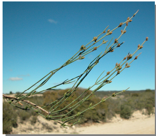
E. nebrodensis . Detalle de rama con conos femeninos