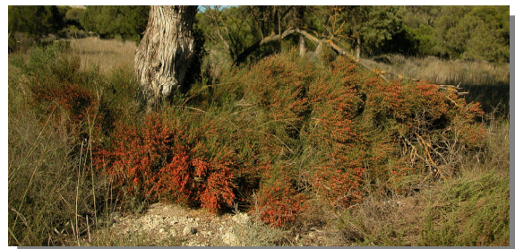
E. nebrodensis . Pie femenino con estróbilos maduros. La Retuerta de Pina; Pina de Ebro (02/06/2014)