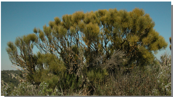
E. nebrodensis . Pie masculino. Vireta; Pina de Ebro (16/04/2014)