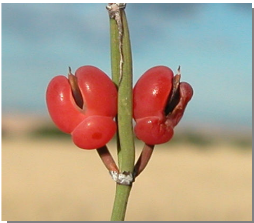
E. nebrodensis . Detalle de estróbilos con brácteas rojizas