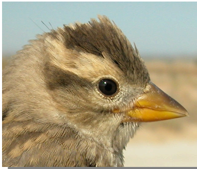
Gorrion chillón. Diseño de la cabeza: arriba adulto; abajo juvenil