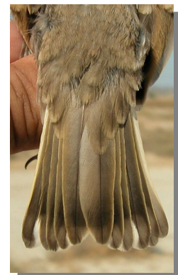
Gorrion chillón. Diseño de la cola: izquierda adulto derecha juvenil