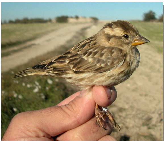
Gorrion chillón. Adulto