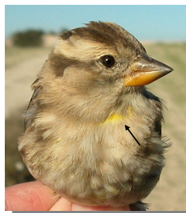
Gorrion chillón. Diseño del pecho y cola.

Con una mancha blanca en las plumas de la cola.