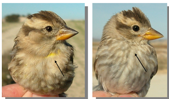
Gorrión chillón. Determinación de la edad. Diseño del pecho: izquierda adulto; derecha juvenil..