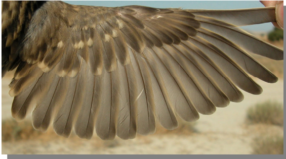
Gorrión chillón. Juvenil: diseño del ala