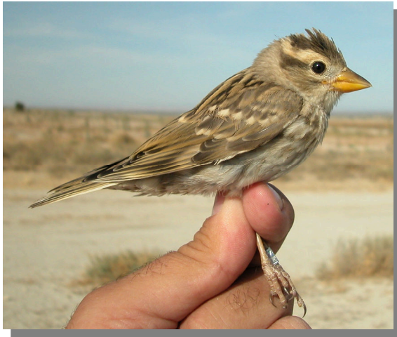
Gorrion chillón. Juvenil