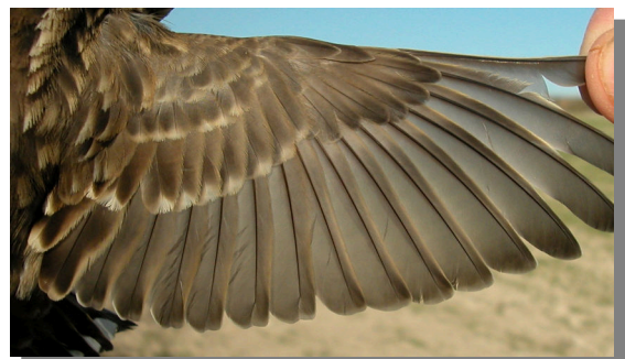
Gorrion chillón. Adulto: diseño del ala