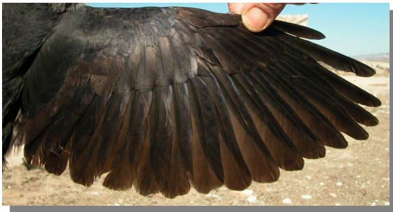
Grajilla. 2º año: diseño del ala