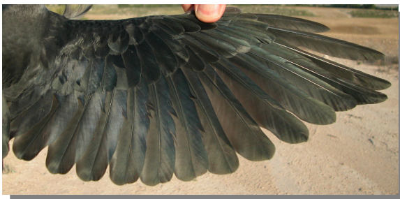
Grajilla. Juvenil: diseño del ala