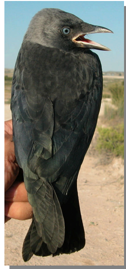
Grajilla. Diseño del dorso: arriba izquierda adulto; arriba derecha 2ª año; izquierda juvenil