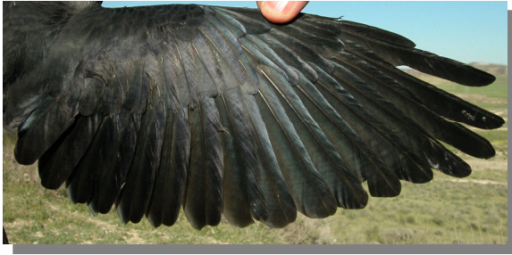
Grajilla. Adulto: diseño del ala