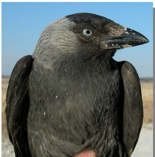
Grajilla. Diseño del pecho: arriba adulto; abajo juvenil