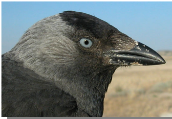
Grajilla. Diseño de la cabeza: arriba adulto; abajo juvenil