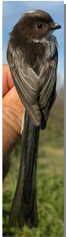
Mito. Diseño del dorso: izquierda adulto; derecha juvenil