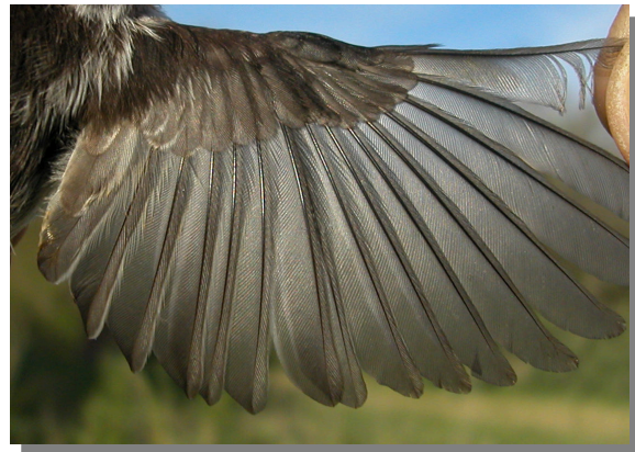
Mito. Juvenil: diseño del ala