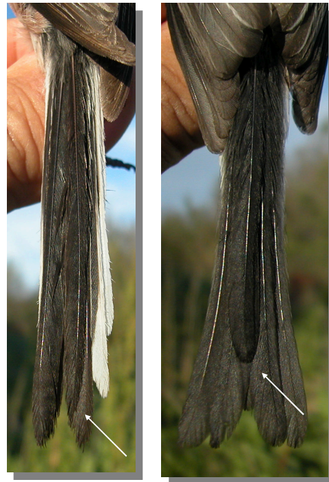
Mito. Determinación de la edad. Diseño de la pluma central de la cola: izquierda adulto; derecha juvenil.