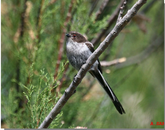
Mito juvenil.