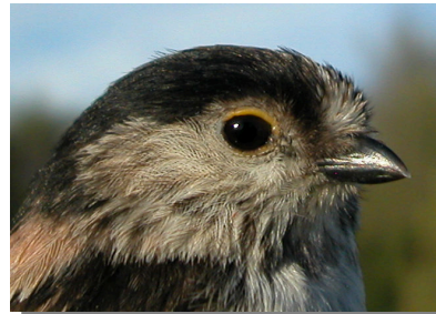
Mito. Diseño de la cabeza: arriba adulto; abajo juvenil