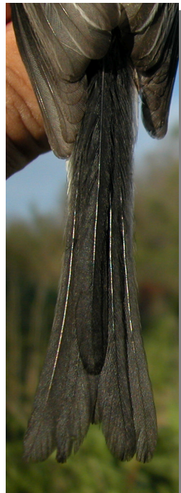
Mito. Diseño de la cola: izquierda adulto; derecha juvenil