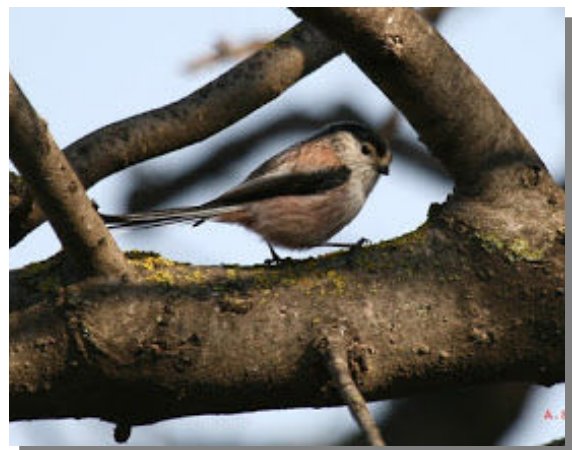
Mito adulto.