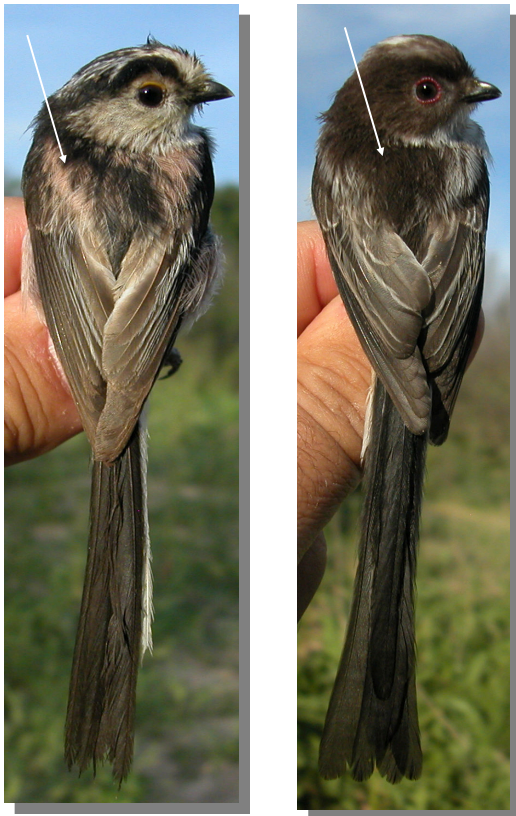
Mito. Determinación de la edad. Diseño del dorso: izquierda adulto; derecha juvenil.

Después de la muda posnupcial/postjuvenil no es posible datar la edad utilizando el plumaje.