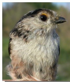
Mito. Diseño del pecho: arriba adulto; abajo juvenil