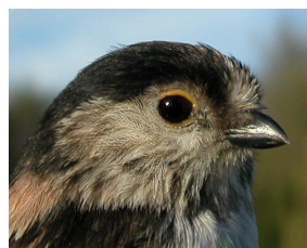
Mito. Diseño de cabeza y dorso

Cola más larga que el cuerpo, negra, con plumas exteriores blancas.